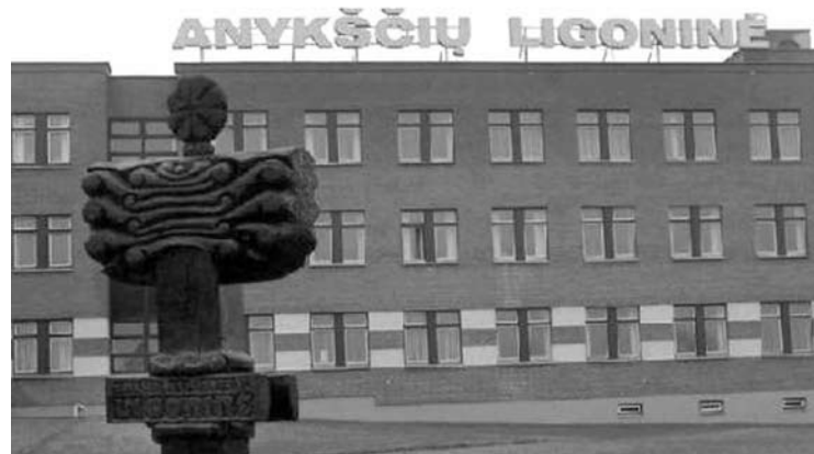
Anykščių rajono ligoninei naujas direktorius šiais metais vargu ar spės pradėti vadovauti.